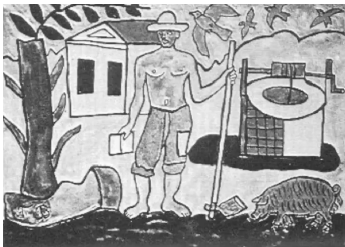
obrázek z praxe kulturních kruhů (Culture Circle)

S obrázkem jedna pedagožka pracovala takto: Ptala se: „Jak vznikly ty věci na obrázku? Jak vznikl ten strom? (Proč je takový?) Jak vzniklo prase? Jak dům? Jak ptáci?“ Docházeli* y postupně k tomu, že svět je přetvářen z přírodních materiálů člověkem. Posilovala tak kritické vědomí síly člověka, který utváří svět.