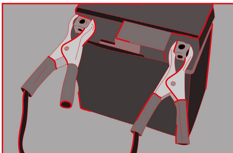
Byl i politický vězeň. Zažil mučení.