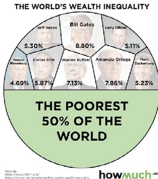
Obrázek 1: Grafika znázorňuje to že osm nejbohatších lidí vlastní stejně jako chudší polovina lidstva, což jsou téměř čtyři miliardy lidí.

Organizace Oxfam každý rok zveřejňuje statistiky narůstající globální nerovnosti. V roce 2022 byl report Oxfamu Inequality Kills zaměřen mimo jiné i na specifika roku s covidem, během něhož bohatnutí bohatých a chudnutí chudých bylo ještě intenzivnější než obvykle. Obdobný přehled vydává World Inequality Report , z jehož stránek můžeme vytáhnout údaje, které rostoucí propast ilustrují. Nejbohatších deset lidí (bílých mužů) za období covidu zdvojnásobilo svůj majetek. Z nich horních osm nejbohatších dnes disponuje stejným majetkem jako celá chudší polovina lidstva (viz obrázek 1). Dnes 10% nejbohatších lidí na planetě vlastní 76 % světového bohatství, přičemž 50% chudších obyvatel světa vlastní 2%. V Evropě 10% nejbohatších vlastní „pouhých“ 60% bohatství (viz obrázek 2). V ČR v roce 2019 vlastnilo nejbohatších 10% obyvatel 64% majetku.